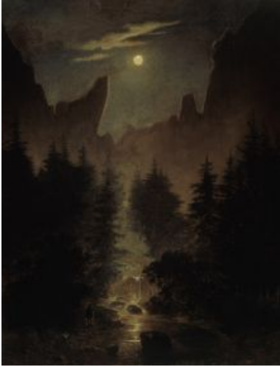
Uttewalder Grund Caspar Friedrich

Es tanzen Mond und Sterne Den flücht'gen Geisterreih'n: Wer wird von Erdensorgen Befangen immer seyn!