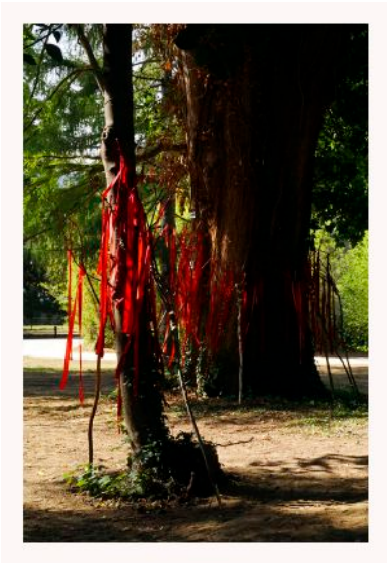
Dans le parc de la Neuenbourg/Guebwiller