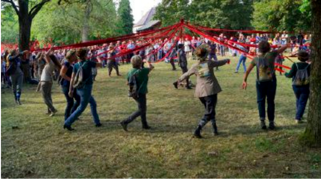
Dans le parc du Château de la Neuenbourg