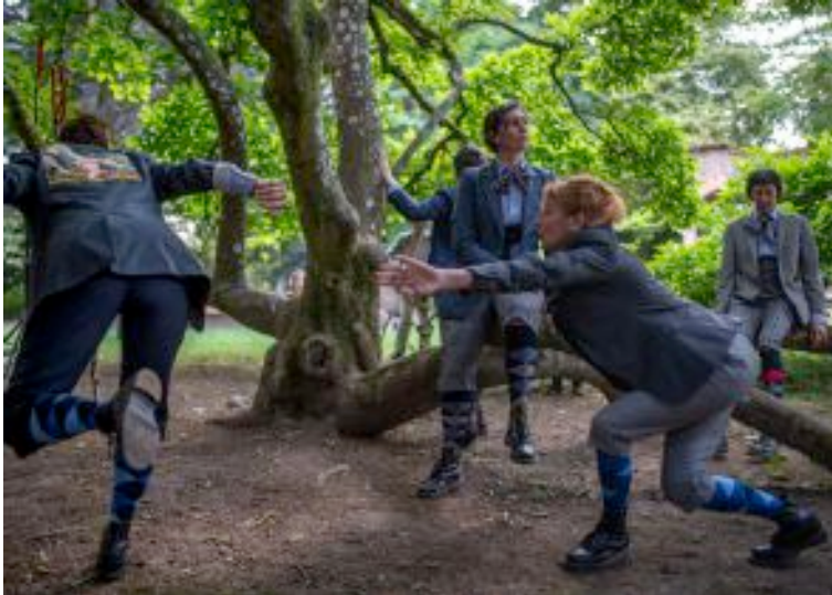
Dans le parc de Senones