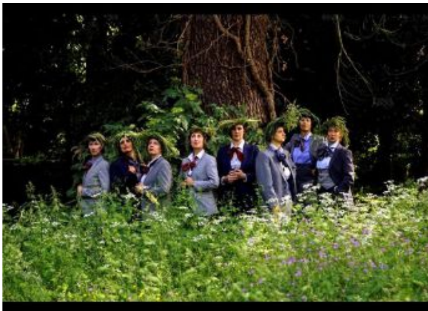
L'échappée sylvestre avec les chanteuses et comédiennes, les Clandestines.

Les neuf comédiennes-chanteuses des Clandestines proposent une performance musicale en déambulation inspirée de Franz Schubert à La Neuenbourg, à Guebwiller. Le premier acte d'un projet en trois parties qui mobilisera dans chaque vallée investie, un chœur d'amateurs.